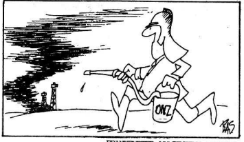
FRANKFURTER ALLGEMEINE ZEITUNG